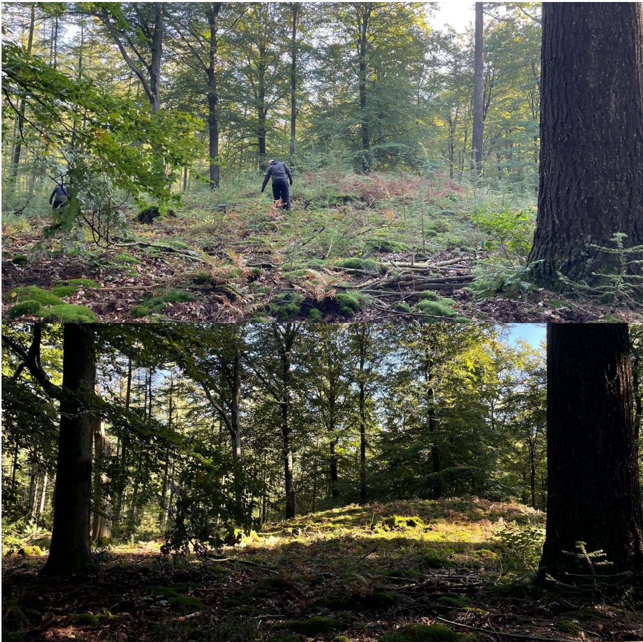
Figuur 2: Grafheuvel vrijmaken van opslag ('voor-en-na-foto')

Werken of gewoon door er te zijn in de natuur is goed voor het lichaam en geest en helpt bij herstel.