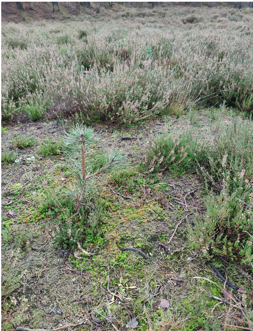
Figuur 7: Jonge grove den tussen de struikhei

Afgelopen jaar zijn de heideterreinen in het Zwolse bos beheerd en grotendeels ontdaan van opkomende opslag van berken en grove dennen. Dan worden één en twee jarige boompjes afgezaagd of met wortel en al uit de grond getrokken. Hiermee wordt voorkomen dat het heideterrein verandert in een bos. Dit werk wordt door zowel aannemers als een vrijwilligersgroep uitgevoerd. Echter blijven er wel enkele jonge boompjes op de heide staan. Dit wordt gedaan zodat de vogels die vooral op heideterreinen broeden een uitkijkpost hebben. Heide willen we in stand houden en dat betekent beheerwerk. Op de Tonnenberg is een vrijwilligersgroep jaarrond actief bezig om de heide mooi open te houden.