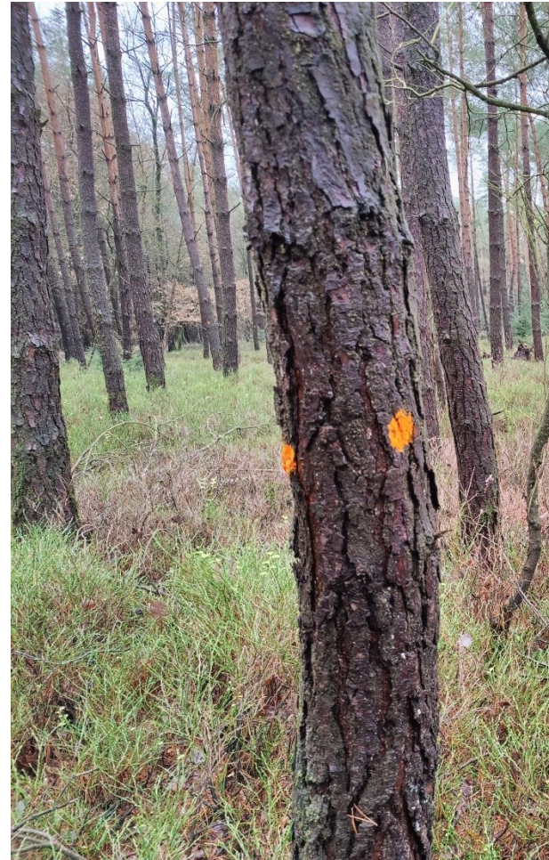
Figuur 6: Oranje stip, houtoogst volgend jaar

Wanneer er meer gebied specifieke werkzaamheden bekend zijn, worden deze in het boswachtersblog gedeeld.