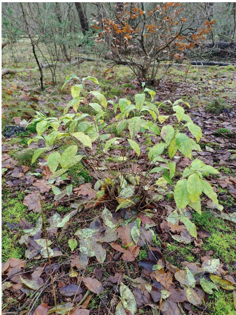
Figuur 1: Amerikaanse vogelkers