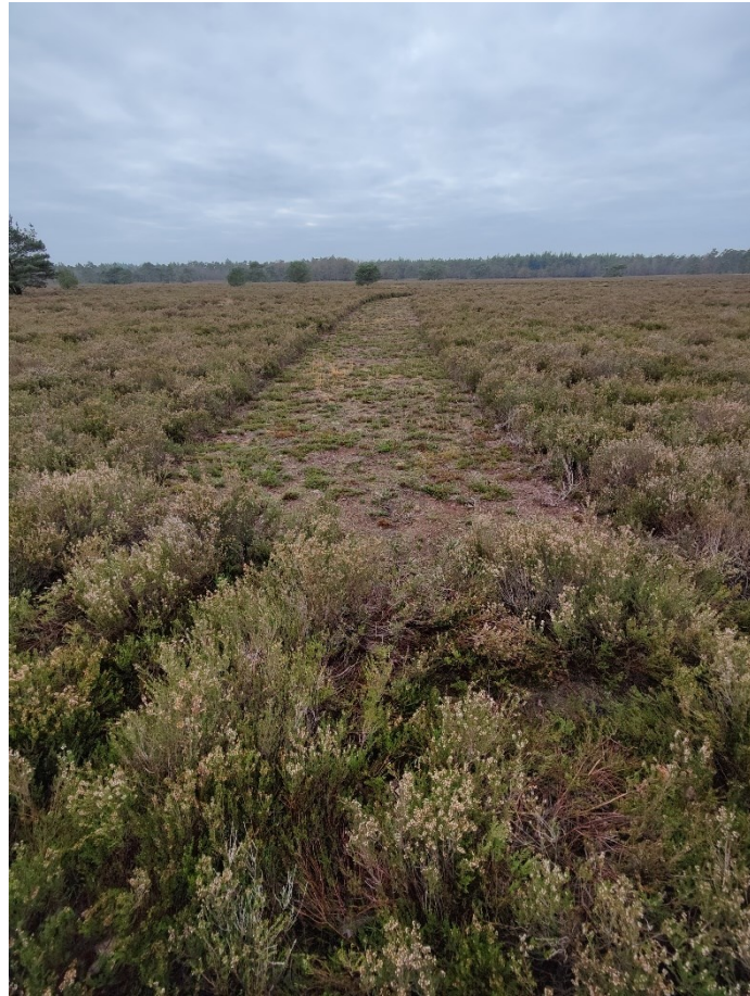
Figuur 9: Aankomend jaar worden er banen gemaaid in de heide

In maart van dit jaar zijn wij benaderd door een medewerkster van Uitvaartzorg Memento Mori te Heerde. Zij had de wens en het idee om aan het eind van het jaar een boomplantdag te organiseren voor de nabestaanden die afgelopen jaar iemand zijn verloren. Als voorbereiding heeft Staatsbosbeheer in het Zwolse bos een aantal boomplantgaten gewoeld in een open bosvak. Hier hebben we samen met de nabestaanden op 8 december 70 jonge bomen geplant. Het is geen herdenkingsbos geworden maar de nabestaanden vonden het een mooi moment om nog even stil te staan bij de overleden personen.