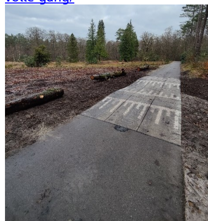
Figuur 3: Verkeersdrempels in de Van Petersom Ramringweg

https://www.boswachtersblog.nl/veluwe/2023/09/27/herstelwerkzaamheden-zandenbosvennen-in-volle-gang/