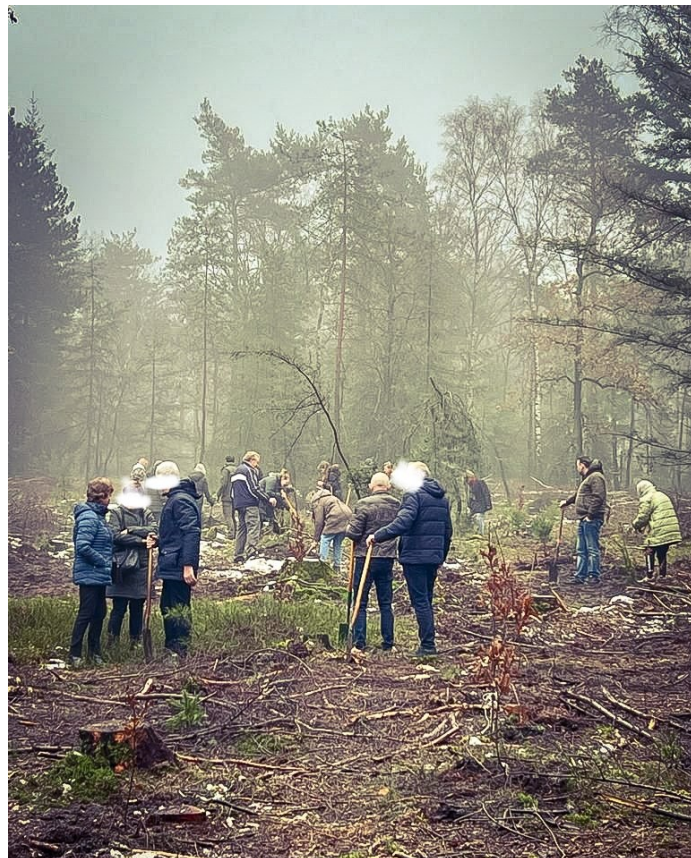
Figuur 10: Plantdag met nabestaande (Uitvaartzorg Memento Mori)