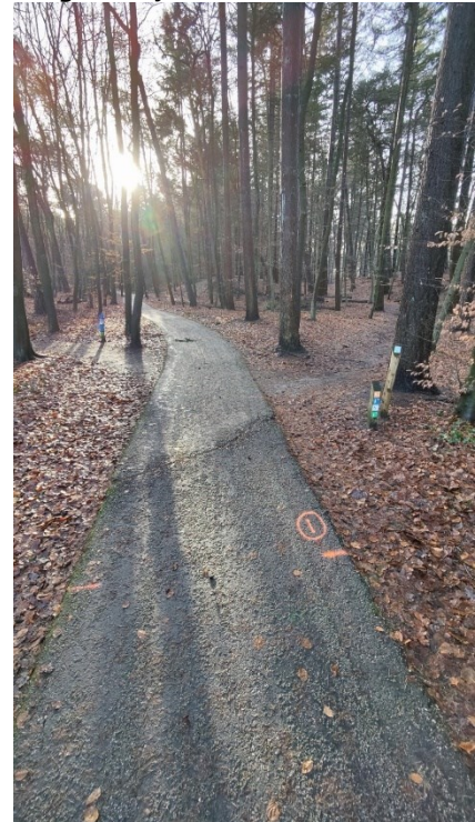
Figuur 5: Rolstoel pad achter het Bezoekerscentrum Nunspeet

nu is het rolstoelpad weer toegankelijk voor iedereen.