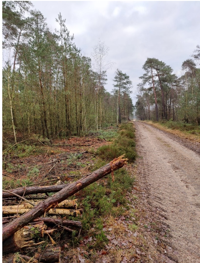
Figuur 4: Zijkant paden ontdaan van dennen

maatschappij. Deze werkzaamheden voeren ze jaarlijks uit in ons terrein. Tijdens de werkzaamheden zorgen ze ervoor dat de uitlopers van de Amerikaanse vogelkers en de Amerikaanse eik weer afgezet worden waardoor de openheid langs de weg behouden blijft.